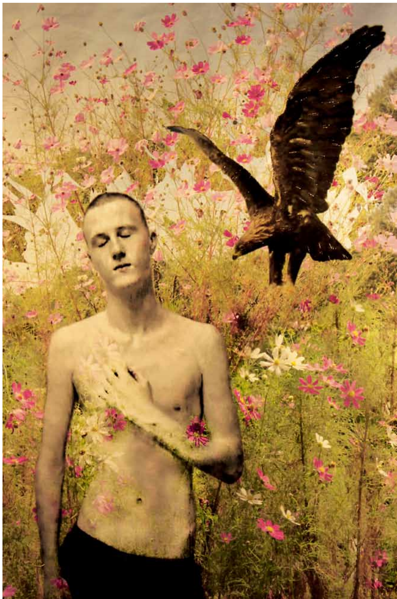
9 普罗米修斯与鹰。帕翠亚·凯西创作于2022年。普罗米修斯被认为是古希腊神话中的魔法英雄。