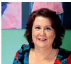
艺术家帕翠亚·凯西肖像