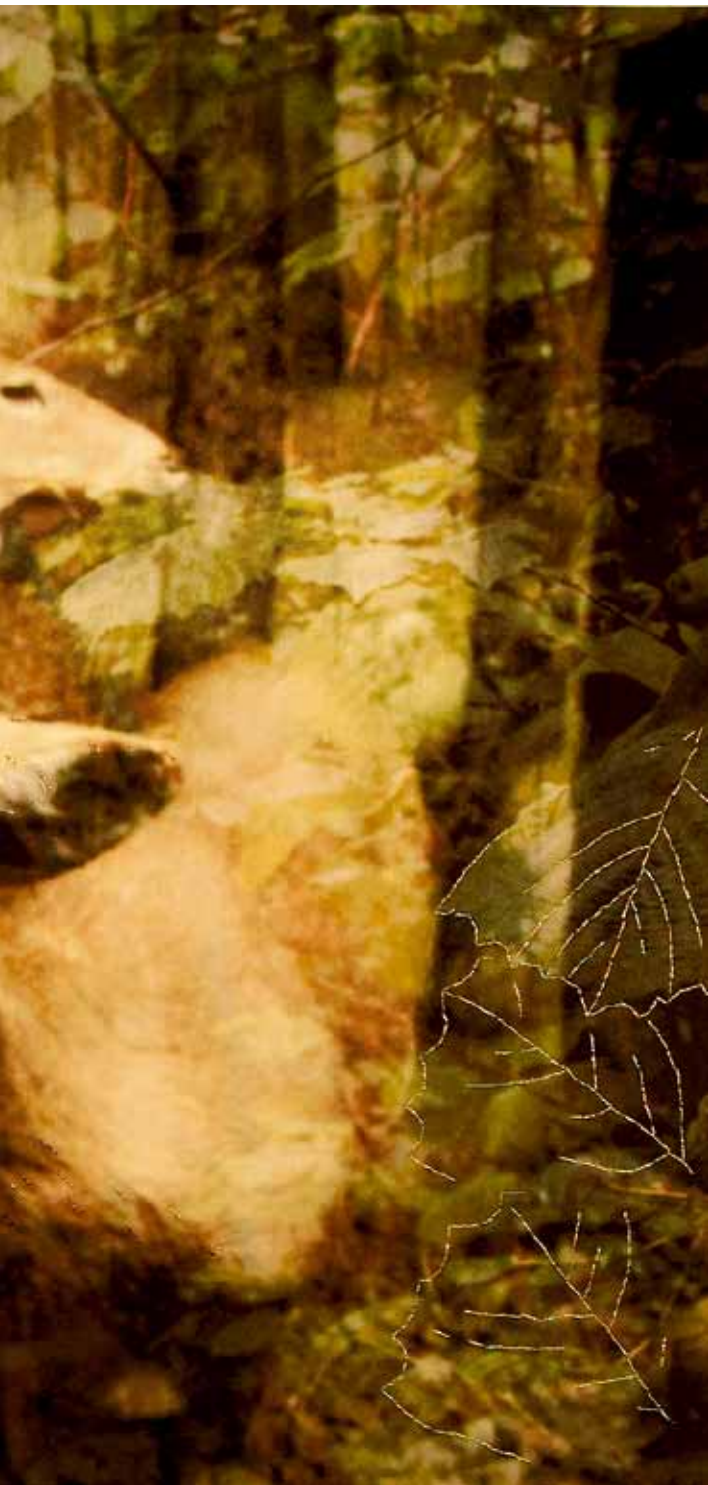
伪装下的愿望。帕翠亚·凯西创作于2012年。